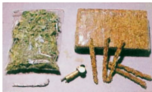
大麻（乾燥した葉・樹脂）