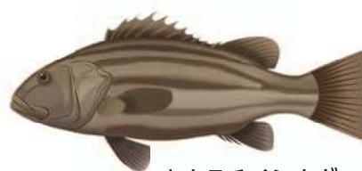
オオクチイシナギ