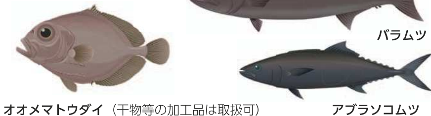
オオメマトウダイ (干物等の加工品は取扱可)