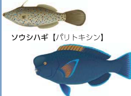
ソウシハギ【パリトキシン】