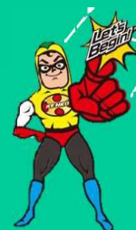
東京都健康づくり推進キャラクター ケンコウデスカマン