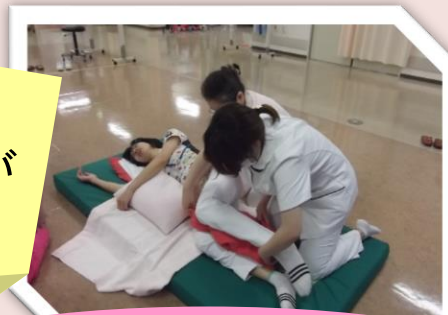
サテライトセミナー