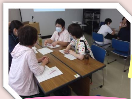
ランチオンセミナー