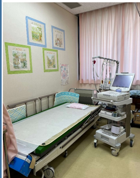
しん でん すしつ 心 電 図 室 に入ります。