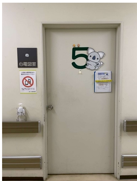
しん でん すしつ 心 電 図 室 (コアラの部屋)