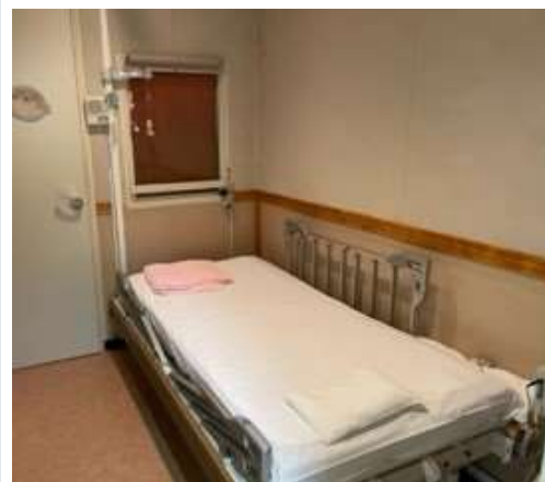
のう は しつ 脳波室に入ります。