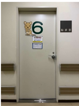
のう は しつ 脳波室 (カンガルーの部屋)