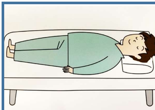
よこ ベッドに横になります。