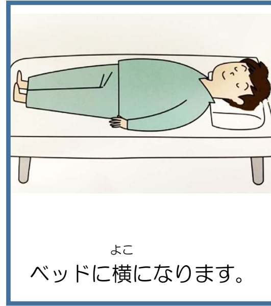
よこ ベッドに横になります。