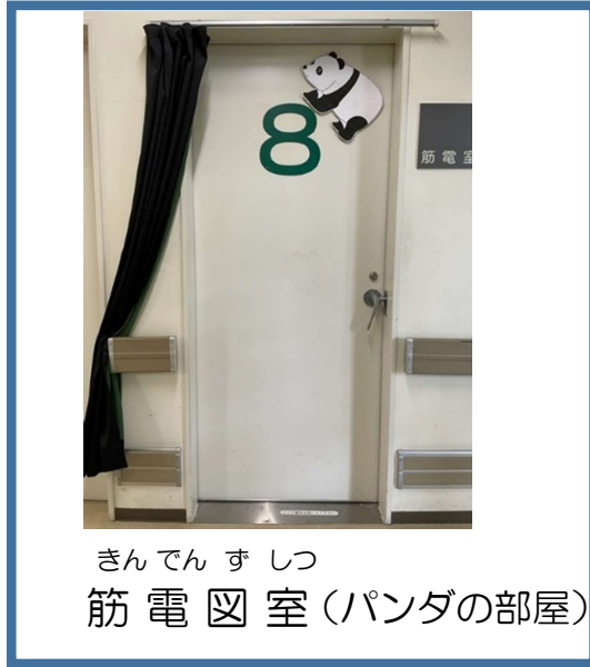
きんでん す しつ 筋電図室 (パンダの部屋)