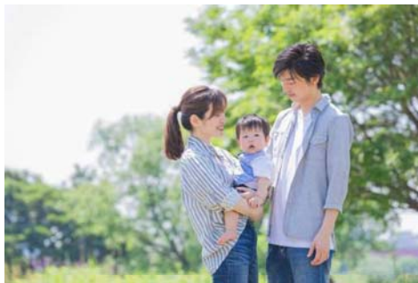
ネウボラの仕組み