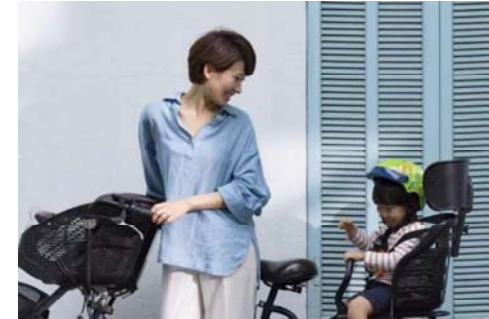
子供目線によるセーフティ・レビュー