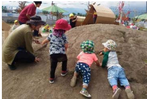
乳幼児期の集団生活