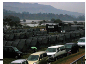
避難テントの様子