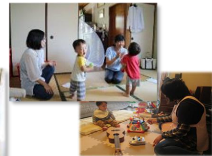
育児支援のイメージ