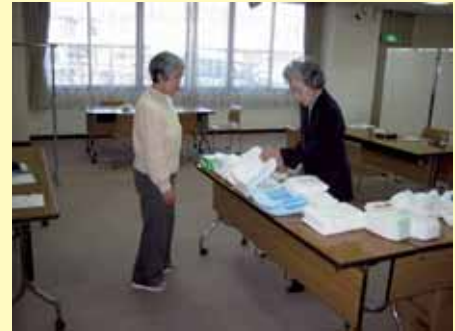
＜相談サロンの風景＞

今後は、地域のボランティアグループの組織化を図るとともに、一人暮らし高齢者の24時間対応の相談・出張体制を確立することや、支援の対象を障害者や子育て家庭などへ拡大していくなどの事業展開とあわせて、モデル事業の市内全地域への展開を進め、将来的には「地域ケア・日本一のまち」を目指して取組を進めていきます。