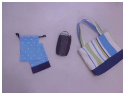
ミシン作業の作品