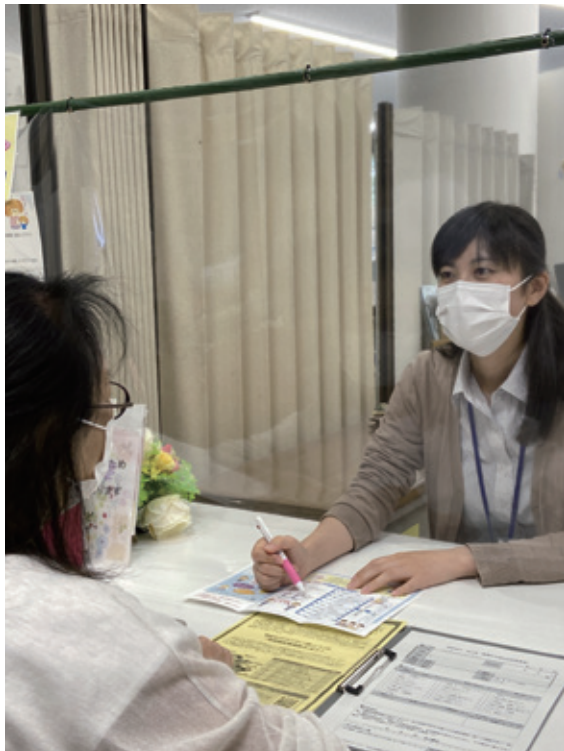
「はちまるサポート」窓口写真

八王子市の関係機関と家族会が参加して実施していたひきこもりに係る情報交換会を、包括的な地域福祉ネットワーク会議のひきこもり支援部会として、正式な会議体として位置づけ、地域、年代を超えたひきこもり支援の担当者と家族会が一堂に会することにより、支援者の相互理解、相互連携を進めるとともに、市のひきこもり支援のあり方について検討しています。