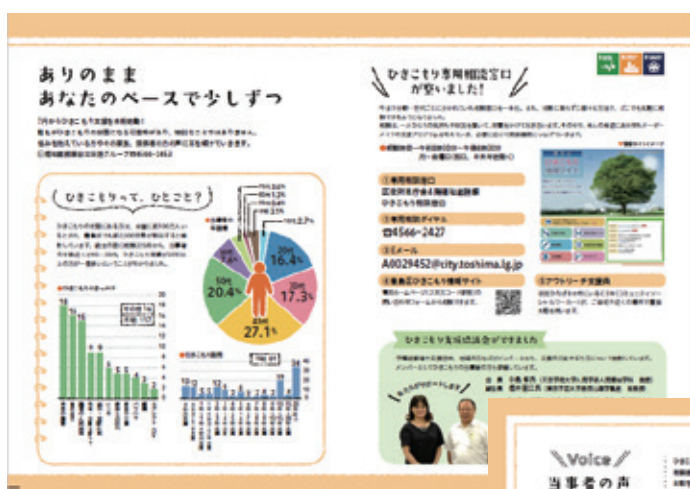
広報としま特別号（全戸配布）

広報としま特別号では、「顔の見える相談窓口」となるよう相談員の顔とメッセージを発信し、全戸配布しました。