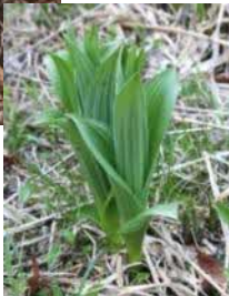
芽出し期のコバイケイソウ