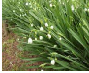
スノーフレーク (スズランスイセン)