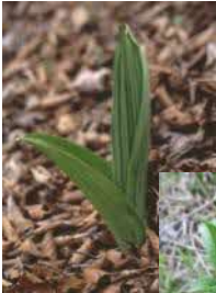
芽出し期のバイケイソウ