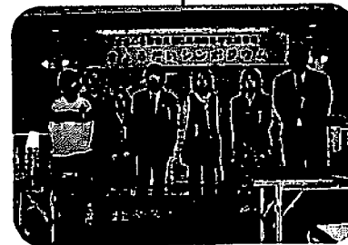
きょうだいシンポジウム