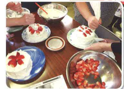
デイケア活動（クリスマス会のケーキ作り）