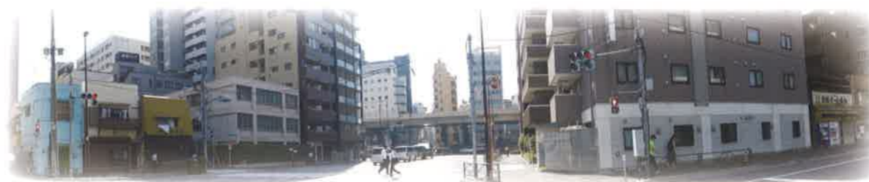
(下谷の旧庁舎 平成 27 年 7 月撮影)