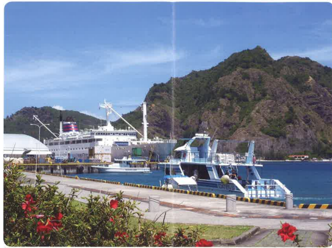
小笠原 父島 二見港

3 こころの病を持つ方の自立と社会復帰を目指して、社会に適応していく力をつけるために指導と援助を行っています。