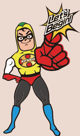
東京都健康づくり推進キャラクター 「ケンコウデスカマン」